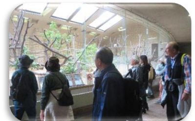
◇コアラ舎(希望者見学)