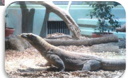
◇最近公開された「コモドオオトカゲ」