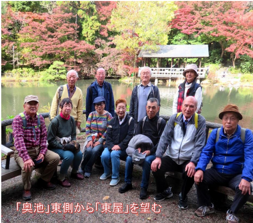
「奥池」東側から「東屋」を望む

名古屋市東山動植物園の「紅葉狩り」は11/16(土)~12/8(日)まで行われ、植物園では11/16(土)~17(日)、11/22(金)~24(日)、11/30(土)~12/1(日)に「紅葉ライトアップ(開園 9:00~20:30)」が行われていることから、散策を楽しみました。